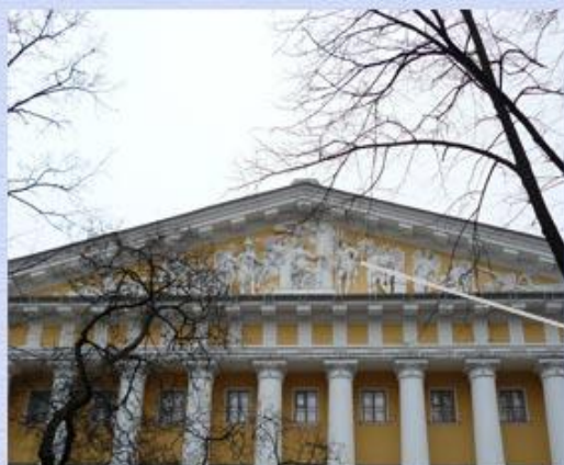
Нептун на фронтоне