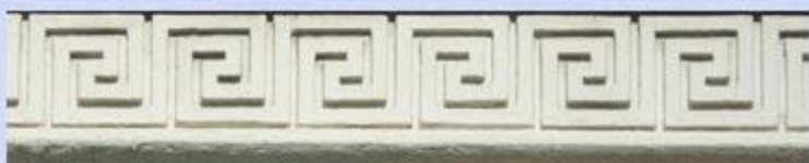
Мошков пер., дом 8