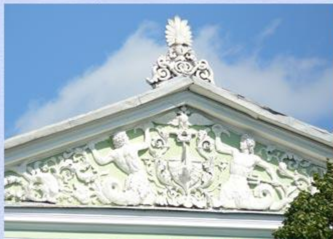
Дворцовая наб., дом 6

Тритоны служат морскому царю Посейдону и царице Амфитрите.