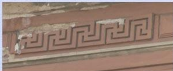
ул. Марата, дом 16