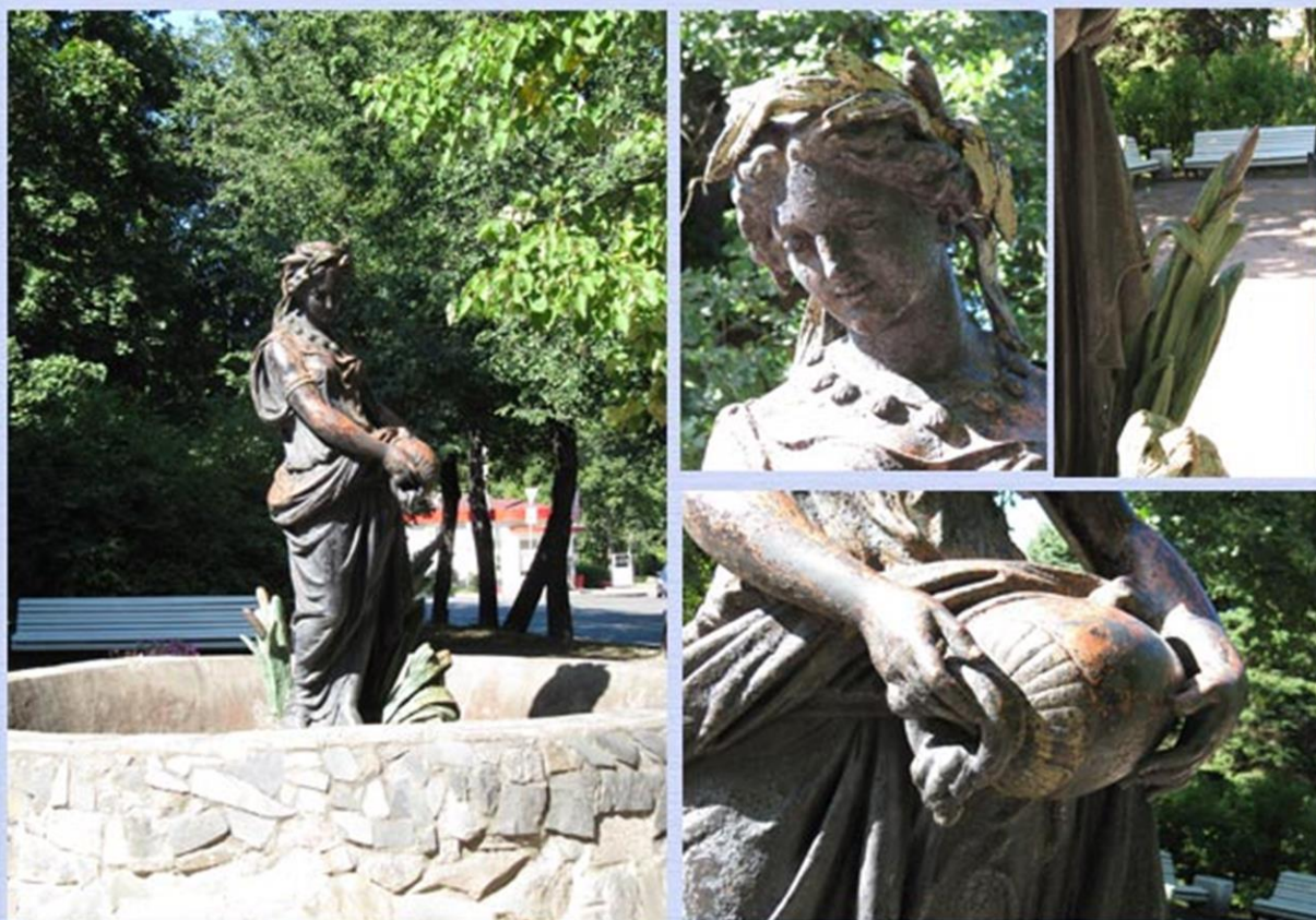
Нимфа ручья, город Пушкин

Нимфы ручья назывались наяды. Люди думали, что наяды живут в каждом ручье, колодце и озере. Наяды живут только в пресной воде. Как только наяда покидала свой ручей, он пересыхал.