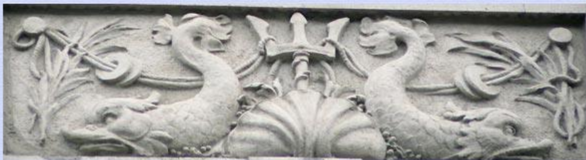
Каменноостровский пр., дом 26-28