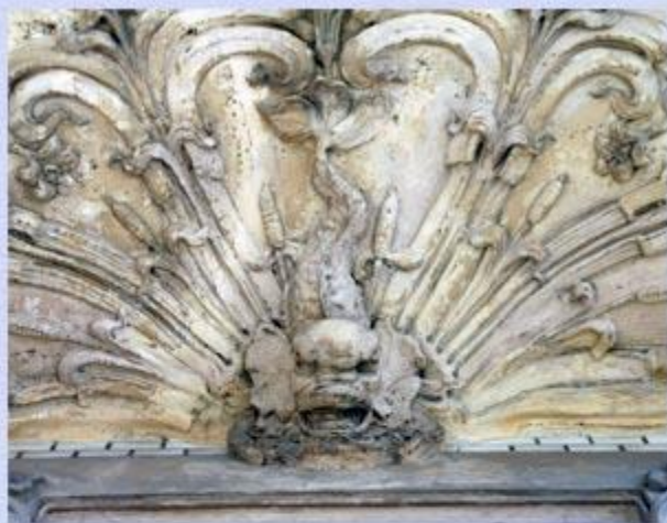
2-я Советская, дом 106