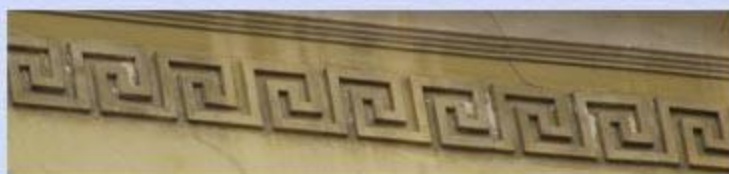
Зверинская ул., дом 21-23